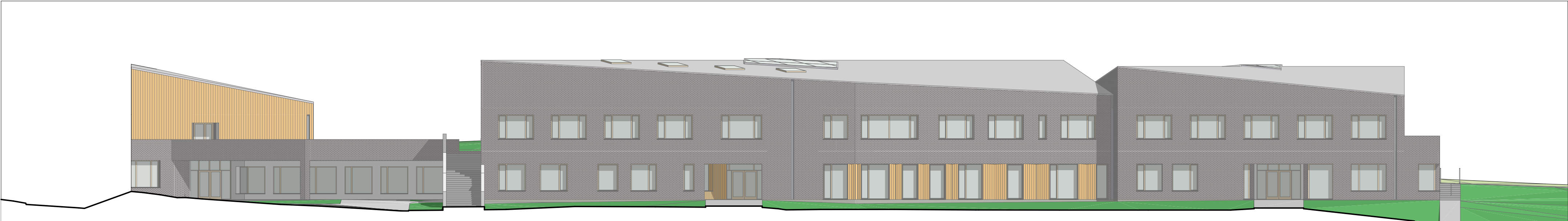
BUDYNEK 2 - ELEWACJA POŁUDNIOWA