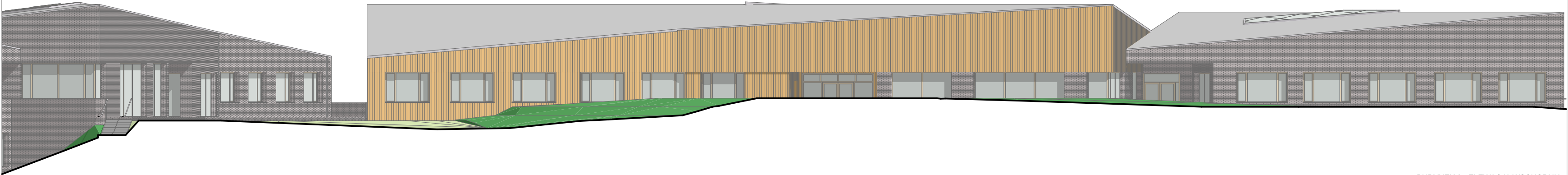
BUDYNEK 2 - ELEWACJA WSCHODNIA